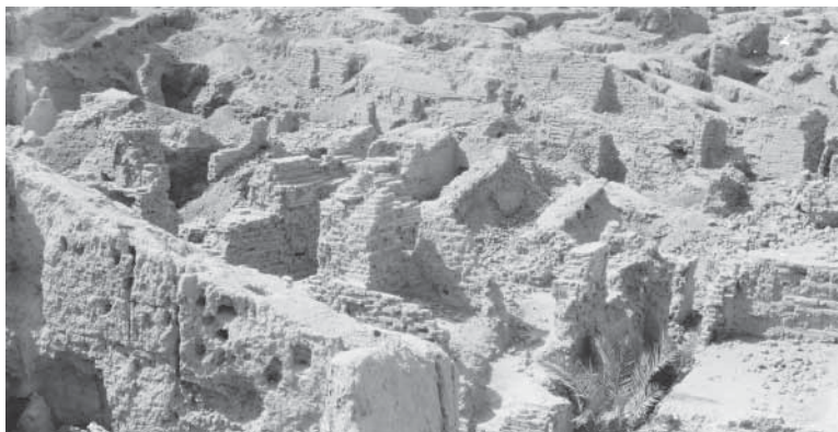
Намрудлул чIой бувну бивкIсса Бабил шагърулул эяллу. Иракъ.

къабитанна», – куну бур. Буюр бувну бур ца чIой бара, куну, мунил бюхттулшивугу ряхра вирсI, утташивугу кIира вирс дусса. Га цуппагу Бабил тIисса клантул лухччиний бувну бур. Яла Намрудлул мукъва барзу ябувну бур дикIуй ва чяхирданий, гайннул гужкъувват хъинну цIакъ хъуннин. Яла тIаннул табут бувну бур мунил ца чул лавай, ца ялавай тIитIайсса. Мугу гай лелуххантрал ччаннацIун бавхIуну бур. Гай барзулт ккашилгу бувну, му табутрал ялув ца ттуршай дикIгу лархъун дур. Яла Намрудгу ца ганал вазиргу му табутравун бувххун бур. Цацалла ца ккурттагу, шанна чIатIаракIгу ларсун дур. Яла га дикI барзултран ккаккан дурну дурча, ми мичча лавай бивзун левххун бавчуну бур дикIуйн тамахIну. Цаппара хIал хъувкун вазирнахъ ялувмур хъулу тIитIа куну бурча, урувгун ур лавай – ссав дусса куццуй ххал хъуну дур. Ялаваймур хъулу тIитIуну бурувгукун, лухччи щатIи кунна, зунттурду пуркIу кунна ккаккун бур. Яла хъулурду лавкуну бурча, цаппара хIал хъувкун, лелуххант бувххун, гъалак хъун гъан хъанай бивкIун бур. Яла кIивагу хъулу тIитIуну ссаврунах урувгун урча, цIан ххал хъуну дур, лухччинух урувгун урча, цIан ххал хъуну дур. Мичча лавай най ца ма-