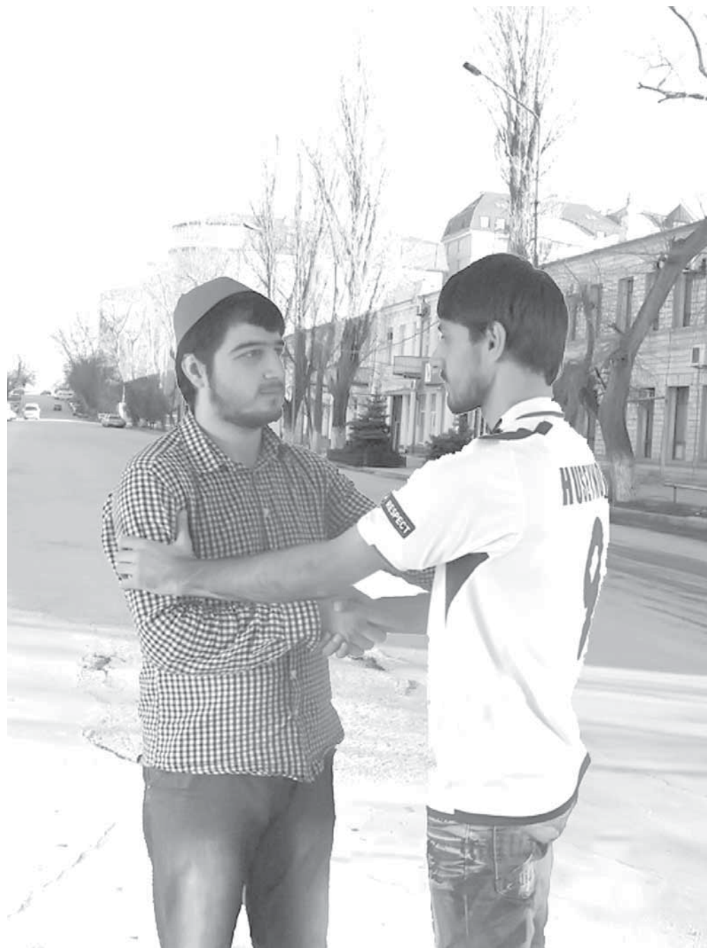
Циняв бусурман уссурвалли.