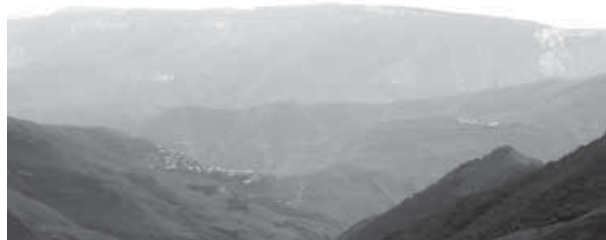
ТтурчIайнна зунтту (ТтурчIидагъ).

Гъашину Надир-шагьнал аьралуннашлсса дягъвилуву ххувшаву ласаврил 270-ла шинал юбилей хъанай дур. Га чIумал лак, яруса, дарги ва цаймигу миллатру чацIун хъуну, хан Муртузали бакIчину, 40000-ннин бивсса ираннал аьрал ппив бувссар. Талатаву най диркIсса ТтурчIайнна зунтту бивкIун бур ливтIусса чапхунчитурал ттурчIардил бувцIуну. «ТтурчIайнна» тIисса цIагу мунияту дирзссар тIийгу бур. Сентябрьданул 14-нний Гъумук хъунин жулва миллатрал тарихраву хъунмасса кIану бугълагьисса иширан хас бувсса мажлис.