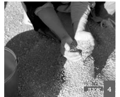
лаж. 4 Рамазан зурул ахирданий булайсса закат