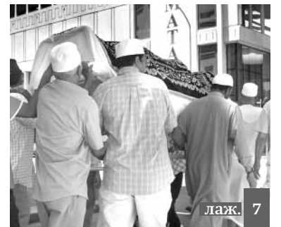
лаж. 7 ИвкIума иссаврил адабру