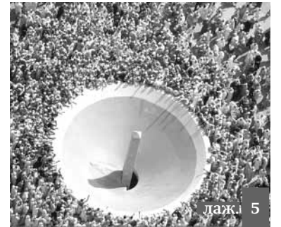
лаж. 5 Исмяил идавс ихлахавил хавар