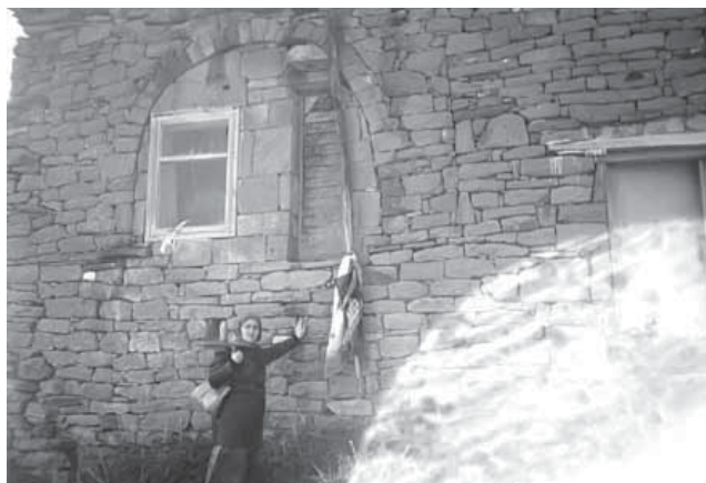
Аь. Хажиева Мухаммад-апаннинал халват къатлуца

Мунинин цалагу Лаккуй къабивкисса на ттула буттал шяравун – Чаящав бивра дахъва ахттакъунмай. Ттул мурад буссия жула шяраватусса шайх Мухаммад-апанни яхъанай ивкисса клантурду ккаккан. Зунтгаву занай вардиш бакъасса на оькки-