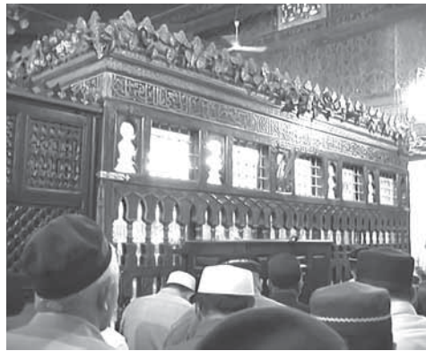
Имам Шафййнал зиярат

Мунал хьиривма Имам – Мухаммад аш-Шафйири  , Идрислул арс, мугу Аьбаслул арс, мугу Оьсманнул арс, мугу Шафййлул арс.