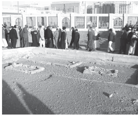
Имам Маликлул зиярат

Хакъмургу, тйайламургу, сахлихсса кашфулийну, миннал дакурдий загьир бувну, Шариатрал хукмурду тахикъикъ буллан тйайла бувсса ми мукъуннаву хьхьича-хьхьичмагу, оьрмулул хьуна хьунамагу, хьхьичра-хьхьичи мазгъаб дирхьумагу – Имамлул-Аьзам