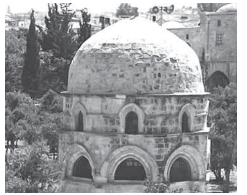
Имам Ахмадлул зиярат

Расуллагьнал   шариат хакъшиврин иман дйшин ялувсса кунна, миннал мазгъабругу хакъшиврийн иман дйшин ялувссар. Ми мукъагу имамнаву ца личину хьун увну, хьин увну, тама кьюкьин увну оь махъ учавугу къабучиссар – тйманангу танмихй байссар. Миннал мукърагу мазгъаб машрикьрайн, магърибрайн дйянин шалла дунияллийх пив хьуну дус-