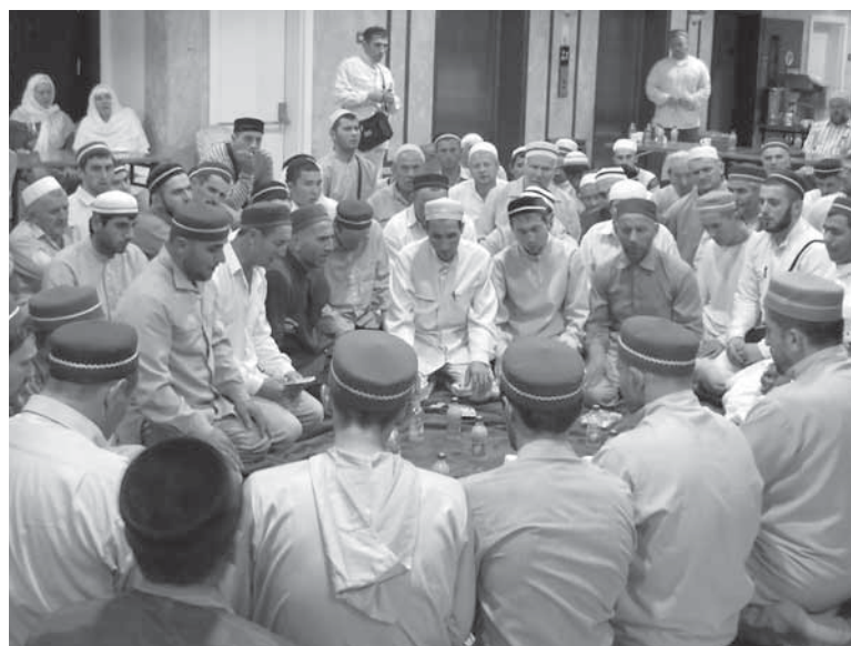
Мавлуд – бусурман чѳѳун бавтѳуну Идавс Ꞥ уваврия ххаришиву даври.

Мухѳаммад Идавсил Ꞥ асхѳабгу, цѳалчинсса халифгу Абу Бакрдул Ꞥ увкуну бур: «Цѳа диргъам бунугу харж буну мавлуд дурма ттушчал ахѳал Алжаннаву икѳантѳиссар», – куну.