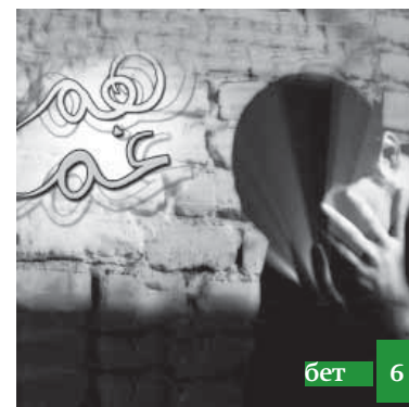
Бизин барыбызны да душманыбыз бир