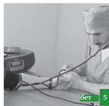
Медицина ораза тутма чакъыра