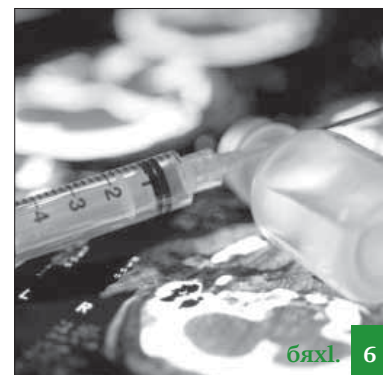
Жагъилти наркотикуназїбад мяхїкамбарес