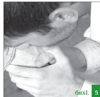
Някъ уммайбарни – Исламлизиб хїурматбирнила лишан