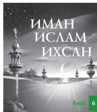
Аллагъ ﷻ ца варни – Исламла хъарихъ