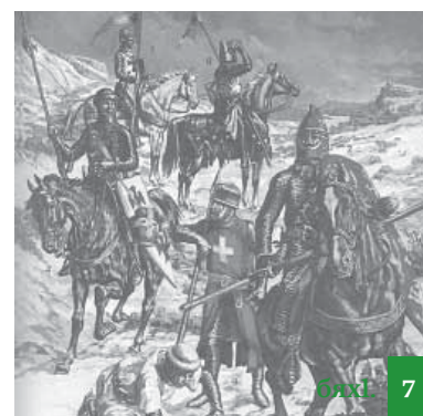
Вагъабизм – ХХІ-ибил дарщдуслихъла балагъ