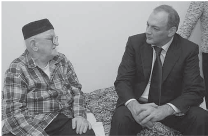
ДР-ла бекёли лебилра ветерантас чёумаси арадеш балгун: «Нушаб дигулра хёуша дахъхли арали кали, хёуша нушани кумекличилра гёрдурцуря».

Центрлизитбани динна тяхъяр-къяйда дузахъес лерилра шуртёри лер.