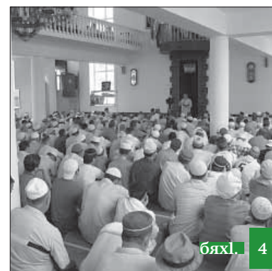
Идбагла хъял тарикъат