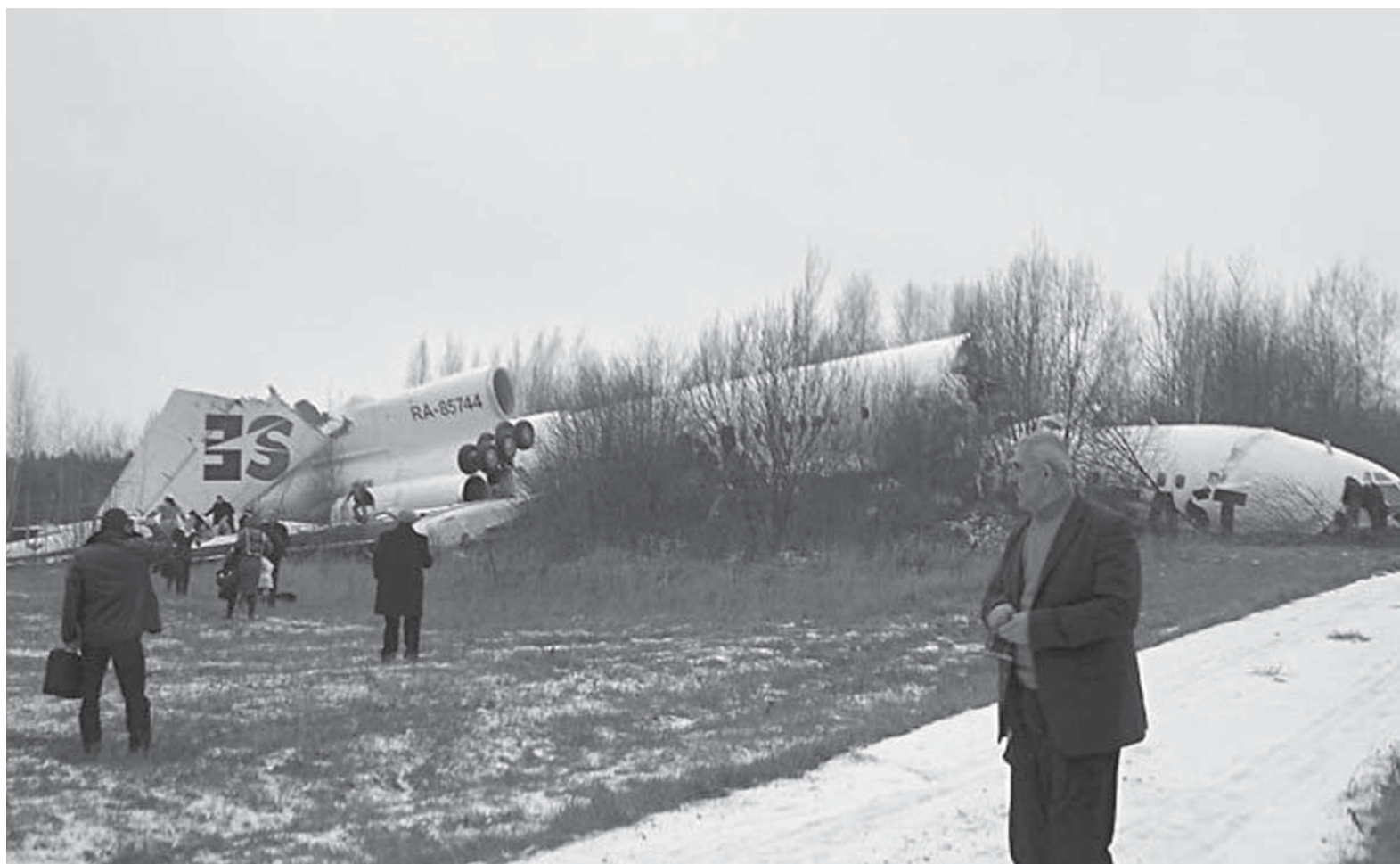
Самолетлабад пассажирти гечбарни.

Итмадан къутла тламал-личил самолет ташбире. Ил замана лебилра кахдеш-лизибри: адамтани се бетаур-лил селра иргъули ахьенри. Кийбил салоннизиб селра-деклар хьедиубси гьунари, ца-биллизибра илкъяйда бур-гар или гьанбикиб нушаб. Амма итабси аги къиянси-