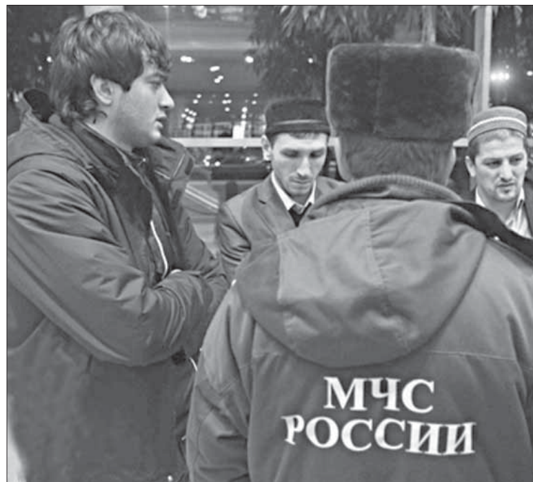
Рейсла пассажирти ва кумекбирани. Дублавад балуй шайчивадси Хиямзат-апанди Гьитинамахияммадов.

Нуни Аллагълизи тила-дибирулра авариялизи бикибти къалабали араби-