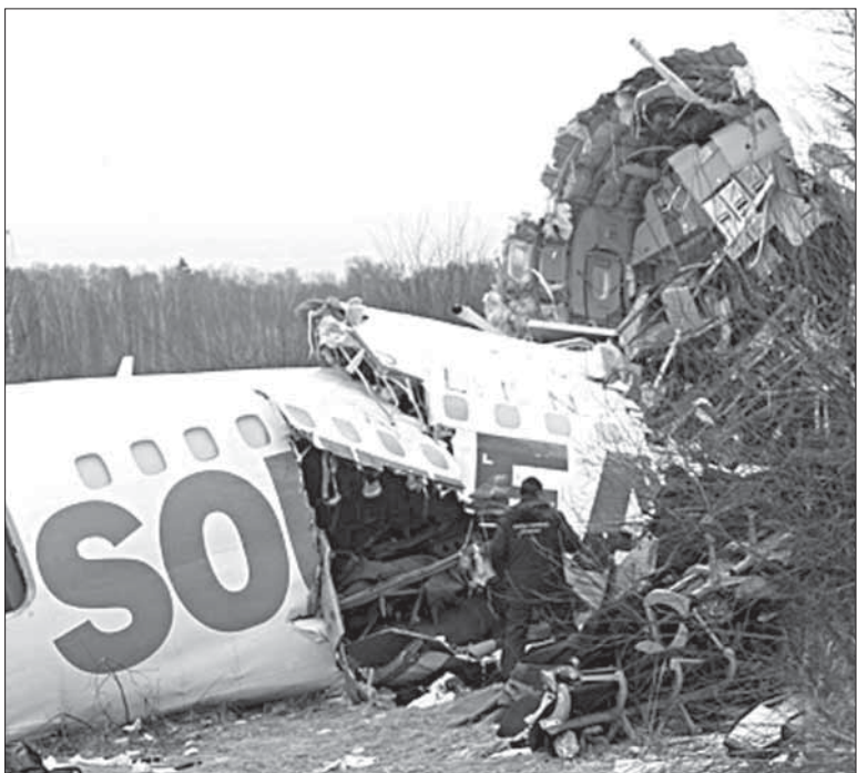
Букъбуунси лайнерла гьаладуб.

ахъес, илдала арадеш ункъ-биахъес. Аллагъли Сунес дигуси барес вируси сай. Илкъяйда нушаб кумекба-рибтази, лебтазилра бар-калла багъахъес дигулра, илди сабри: Москвализиб-ти нушала ватанлантис, самолетла экипаж, тух-турти, ца дилшахъанти ва нушаб къакъабиклули калун-ти цархилти! Аллагъли лебилра берцахъаб ва бихляб!