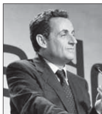
Николя Саркози: «Араб члал жележгинди, илимдинди ва са патан тереф хуьн тийидайди я»

– 16 йис я зун араб члаллах алахъна ва ам чир хъун зун паталди Къуръан, арабрин култура ва адан тарих чир хъун лагъай члал я.