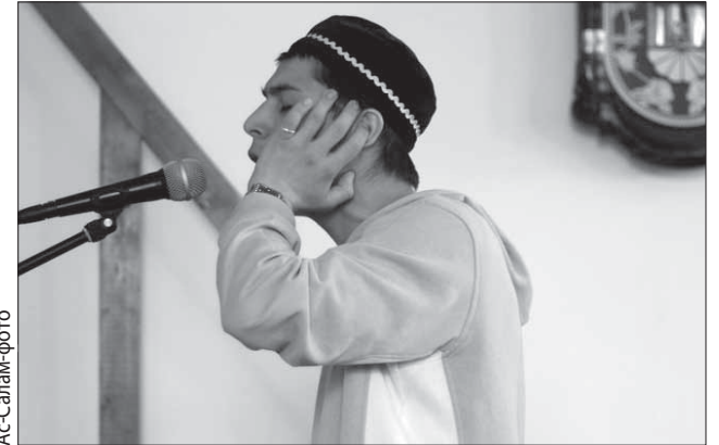
Шафиитдин мазгъабда таржиъ суннат я, Абу-Гъанифадин мазгъабда суннат туш.

Таржиъ-им азан лугъузвайла шагъадатдин къве къайдани вичи-вичикди ван акъуддалди, азан гудалди лугъун я. Таржиъ - им явашдаказ лугъузвай шагъадат я. Нагагъ мусурмандин текдиз капл ийизватла, азан клелдайла ада сифте нубатда вичи-вичикди шагъадат лугъуда (вичиз ван жедайвал), ахпа ван акъатдайвал азан гуда. Жемьтдиз азан гузвайда сифте вичи-вичикди, анжах патарив гвайбуруз ван жедайвал шагъадат лугъуда, ахпа азан ван акъудна клевиз лугъуда.