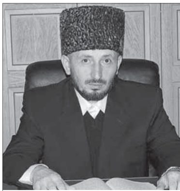
Аллагъу Тааьланал рахиму-цимий бишиннав цинявпагу бусурманнай дунияллий ва Ахиратраву.

Иман цаькъ даврийхчин, Аллагъначан гъан хъуну, Кланан ххира хъунсса шин хъуннав. Омур, бунагъру, лухисса дардру ларгсса шинаву личаннав. Омур хъама битансса ххаришиву ялун дияннав.