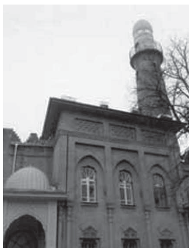
Масала, Чурат тисса шыраву ялапар хьанай бур туркман, Летняя Ставка тисса шыраву

Гайннач^ан бувкун бур Дагьусттаннаясса хьамалгу. Бувк^иминнал барча бувну бур кьирагу шыраваллил жьаматру ва дуаь дурну дур рувханийсса ххуллий бачинсса, Ляхьан бувма рязий ансса. Амин.