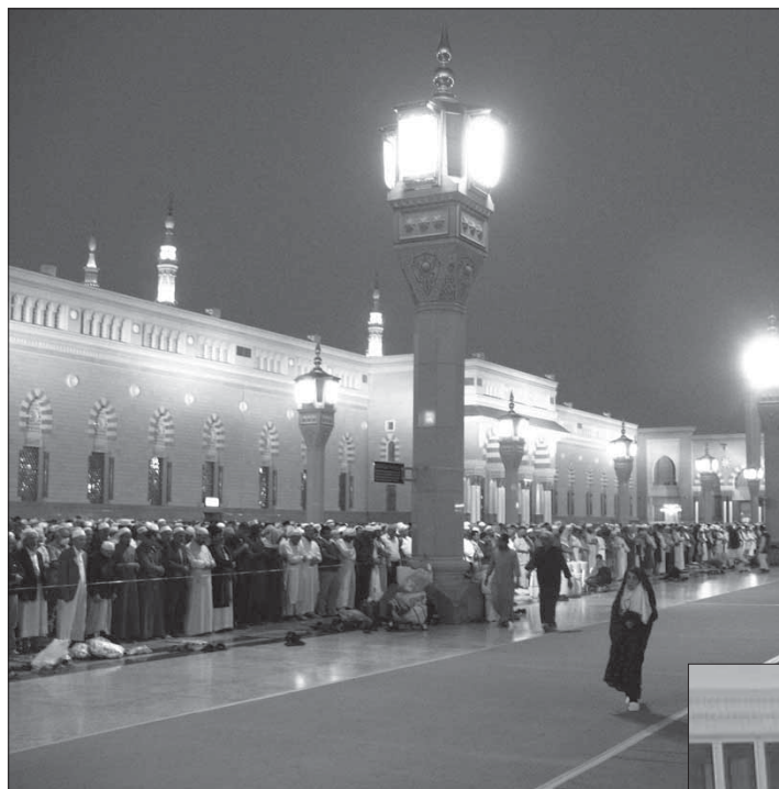
Амма и дуьшуьшда а кас яшлуди ва я сагъламсузди хъана кIанда. Гъа и карни Аллагъдикай кичIе къве духтурди тестикъарна кIанда.

– Эгер вуна вал ферз тир гъаж къиле тухванватIа, ваз масадан паталай гъаждал фидай ихтияр ава.