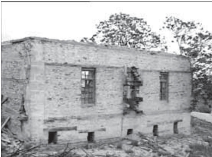
Гилийрин хуьруьн куьгъне мисклиндин харапаяр

Къейд авун лазим я хьи, куьгъне Гилийрин хуьре мисклиндин дарамат гъеле амазма. Им архитектурадин халисан памятник лагъайтла, чун ягъалмиш жедач. Вучиз? Ам къетлен проектдай эцигнава, ахътинди мад Дагъустанда гъич са хуьрени авач.