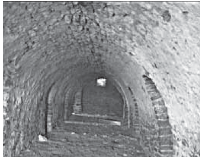
Куьгъне мисклиндин кІаник мутааллимар яшмиш жезвай чка

Эхирдай заз лугъуз кІанзава хьи, Мегъарамдхуьруьн район диндин рекъяй са акъван вилик галачтІани, ам вилик тухун патал ина вири шартІар яратмиш жезва. Къейд ийиз жедай кар