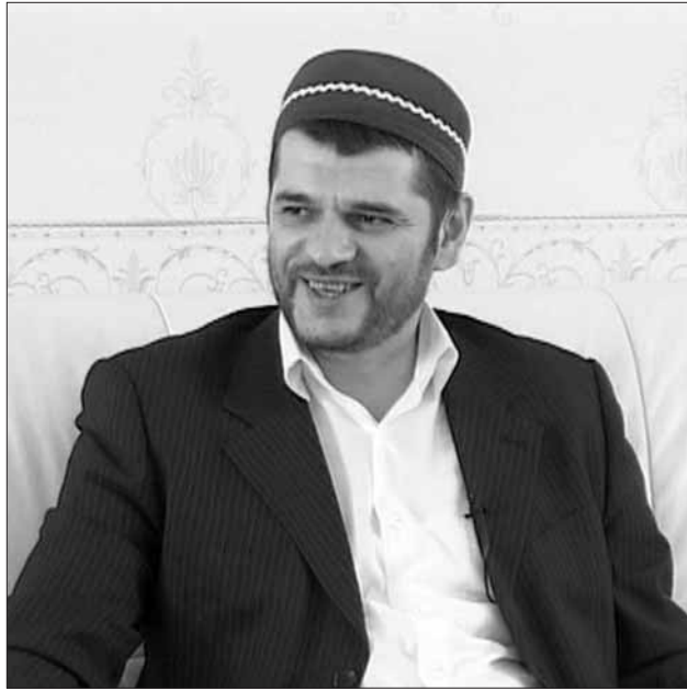
кирттал, СПИД-рал жулва жагъилтурал бакIрачIан хъуни-хъунисса баларду буцлай бушиву бусласисса передачартту, видеофильму.

Абдуллагълул цува редакторшиву дуллалисса телеканалданий чIяруну ккаккан дайва наркоти-