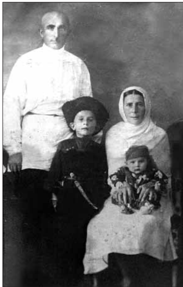
Буран бишлай бурвав Буттал шяравух, Гьулусанну дурхха Даки тачлав дакъа.

Чявхъа бутлуривав Кьума ратлавун, Бявххун бавчуннихха Мукъаву яру.