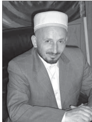
Гerti ва терен иман, яхшы ишлер этмеге ва эки де дюньяда насип ёрайман!

Дагъыстанны муфтиси Агъмат гъажи АБДУЛАЕВ