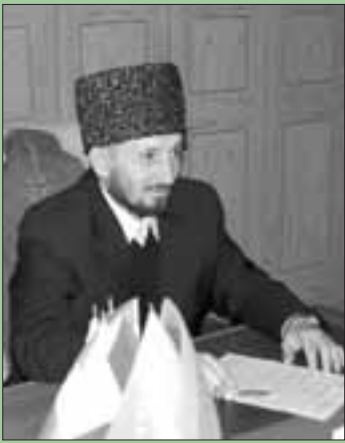
РАГЪМУЛУ АЛЛАГЪНЫ АТЫ БУЛАН!