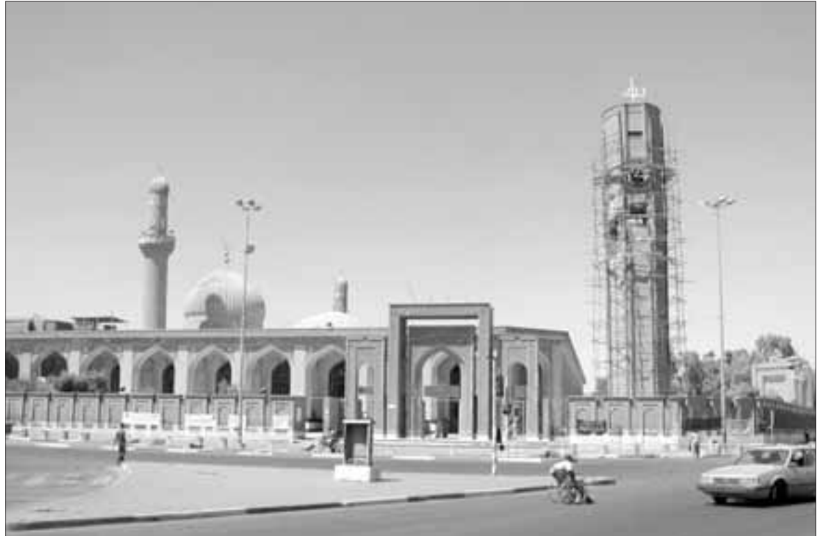
Багъдатдагъы (Иракъ) имам Абу Гъанипаны رضي الله عنه атындагъы межит

ланы чечмек учун тюз ёл табагъанларыны ойларын къабул эте болгъан. Бир-бирде шолай бир масъаланы чечмек учун бир нече гюн гъажатлы бола болгъан. Шо ёрукъдагъы уьйретив эркин кюйде юрюген, шону ортакъчыларыны барысыны да пикруларына гьюрметли янашыв булан тынлангъан. Арагъа салып ойлашыв буса, муталимлени гьакъылына гьакъыл къошгъан, оланы билимин ва лайыкълыгъын ташдыргъан. Шо къайда булан фикхны тармагында къайсы буса да бир масъала чечилсе, къабул этилген къарар тюз тюгюл деп билдирме бажарылмайгъанны айтмагъанда, гъатта танкъыт этме де бек къыйын болгъан. Аль Мувафакъ аль-Макки булай айтгъан: "Озьюню мазгъабыны ёлларын онгара туруп, Абу Гъанипа رضي الله عنه озьюню муталимлери, озьюню масгъабындагъылар булан маслагъатлашгъан ва гьеч бир де оьзтёрече иш гёрмеген. Ол янгыз Аллагъгъа, Расулуллагъгъа ва бары да савлай муьминлеге бакъгъан