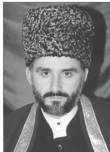
Музабухъунтала ургаб машгурти динна гялимти, гилмула вакилти, политикуни, жамигъатла хяракатчиби, муфтийла гъалмагъуни, илала гъамти ва илала хурматбирути бахъал цархилти адамти лебри. >>3

Августла 21 – Дагъиста муфтий Сайидмухаммад-хияжи хиллакардешличил кавшибси бархи саби. Мяхячкъалализибси КIарахъала театрлизиб ил пергер адам гъаниркахънилис багъишлабарибси балбуц дураберкиб. Муфтий кавшибхлейчирад вецал дус диркнилис багъишлабарибси ил балбуцличи республикала жамигъатла бахъал вакилти цалабикиб.