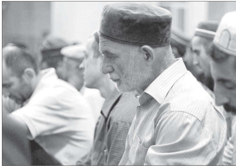
Ихътин крар инкар авун, абур дуъзбуру туш лугъун кутугнавач, гъик хьи, абур лап тлимил зарар гузва. Абур

Шиблидив ахвар агатдайла, ада вич нацуналди гагадай, экуън сегъердалди нацларин клватлал куънягъ жедай. Чехи пай вахтара ада вилеривай къел гуъцдай, вич ахварал тэфин патахъай.