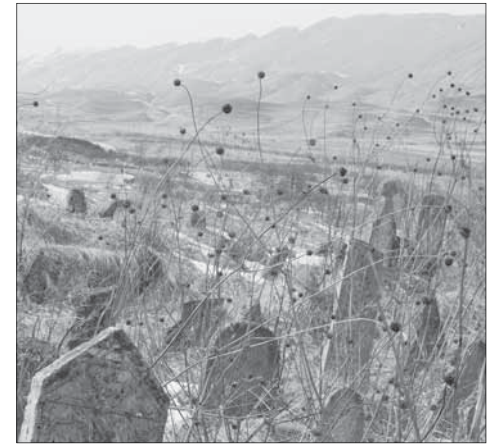
туьк̄уьрнавай шиирар к̄елзава.

Идалай гуьгъуьниз абур ам хайи к̄вализ къезва, ана мугъманриз т̄лун-хъун гузва, гъар садав садакъяарин пай вахкузла. Инал атанвайбуру Вагъуф п̄ирен к̄вале мавлидар к̄елзава, адан уьмуьрдин аламатрикай суьгъбетар тешкилзава, адаз бахшна