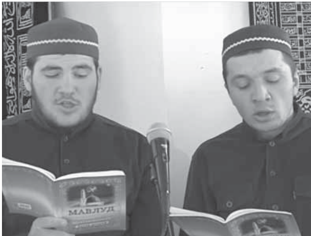
Мавлуд ккалаккисса мутааълимтал