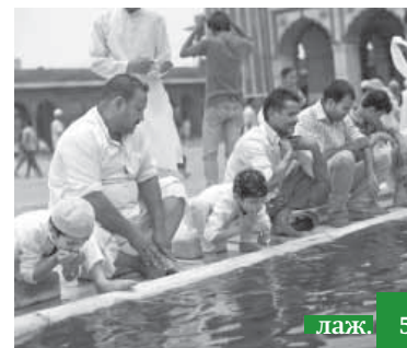
Чаклин иссаву ва мунил суннатру