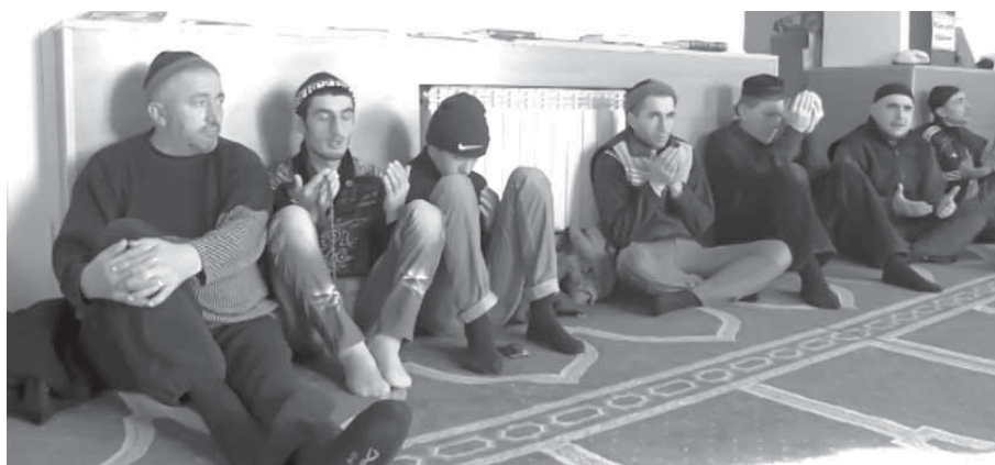
Гъазу-Гъумук Ханнал мизитраву