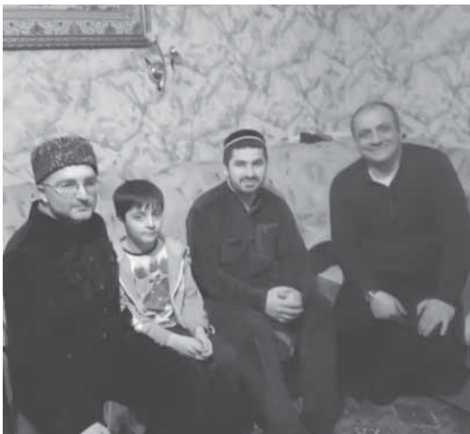
Давуд-хлужи Тумалаев Мурманск шагърулийсса лаккучуначйа мавлудрай