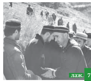
Жижара лайкъну бувара!