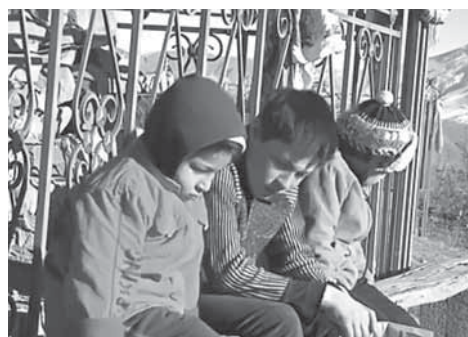
Читтурдал шяраву мавлудрайн бувкІсса оьрчІру

1 « Вания мукъаху, гъарца шинал жамятру цацІун хъуну, бюхъаймий шагъуррдаятугу бувкІун, ххуйсса мажлису буллансса ният дур. Мунил жулва Лакку билатрай барачат шиная шинайн гуж хъанахъи бантІиссар. Лаккуйн бара-чатшиву кІура даян давриву, цал-чинсса кІану бугълагъиссар мавлуду дуккавил. Му жува цинявннал хъинну къулагъас дан аьркинсса ишри, цанчирча, Аллагъу Тааьлал шалва аьлам, дунял Цана яла