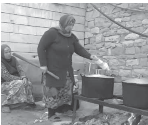
Мавлудрайн дукра дуллалисса лакку хъами