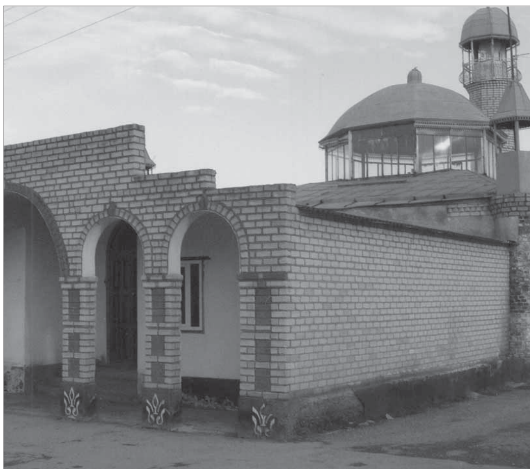
Сурагъа: Ботаюртну жума межити