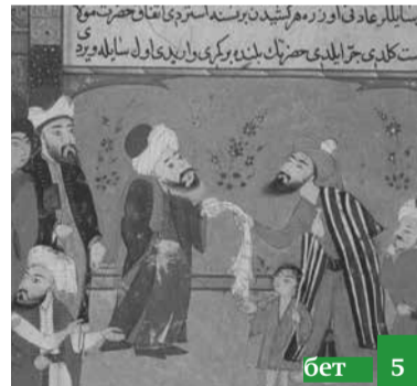
Лап бай бола туруп, юхугъа батдым...