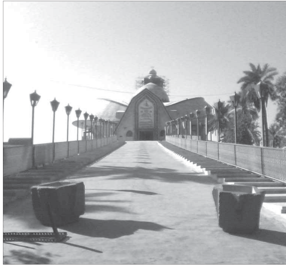
Багъаддлизибси МягIруф Ал-Кархила зиярат

Аллагълис гIибадат барес пикрибариб, лерил секIал, хIянчи дархъдатур, сунела мугIяллим ГIяли бин Муса ар-Ризас къуллукъбирнила хIянчи ахIенци. Марлира, илини сунела лебил замана арагIевли гIибадатбирнилисцун харжбирухIели. Аллагъли ил черяхIти, дурхъати гIяхIдешуна гIевуциб иш дунъяличив ва Итил дунъяличив, адамтас биалли ил дебали дигахъусири, халати гIялимтасра балли ва ила-