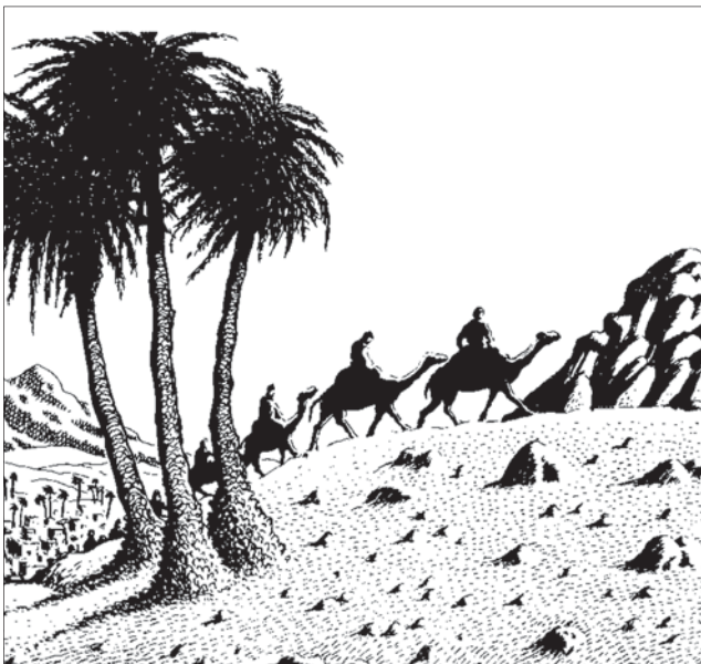
Зубаир, ГIябдурахIман, СагIаду, СагIид, Абу-Гъурайрат. Илдас гIергъиси дурхъадешла ганзухъличиб

ГIергъиси ахъси даражаличиб чебиур мицIирли лебай саби гъалжанализи аркниличила бушра (разиси хабар) бакIибти 10 асхIяб: Абу-Бакар, Пумар, Пусман, ГIяли (илди халифунура сабри), ТалхIят,