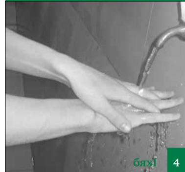
Дазала дирухъели Аллагъ уркілауцибсила лебил къркъала умубирар