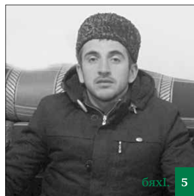
БидгІяличила гІялимти се биклулил