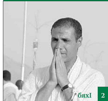
Тавбу дируси бунагъуни агарасигъуна виар