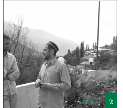
МяхӀячкъалала халал мижитлаб мавлид бариб