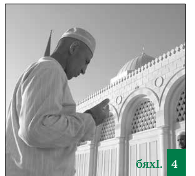
Се сабу тавассул ва ил асубирусив?