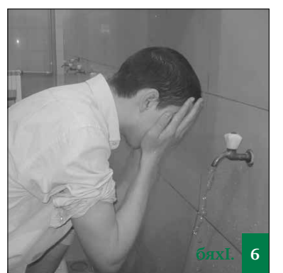
Имам ШафигӀла мазгъаб хӀясибли, лерил суннагуначилти дазала