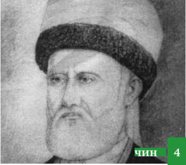
Зурба алим ва бажарагълу шаир