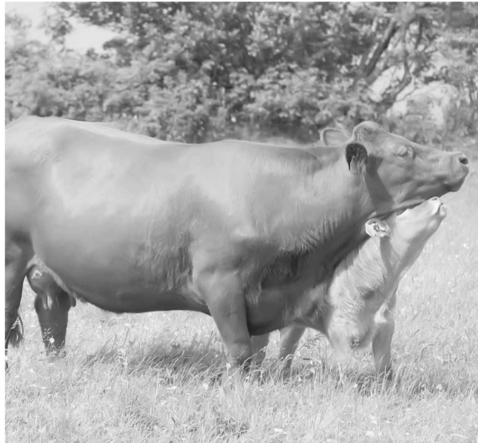
Дана туклуна тлуьрдалай къулухъ Исади ﷺ адал Аллагъдин ﷻ куьмекдалди чан хъана

далди яна ва лагъана: «Аллагъдин ﷻ ихтиярдалди къарагъ!» Мирг къарагъна ва гъинихъай атанайтга, гъа патахъ кат хъувуна. «Субгъаналлагъ» - гъарай акъатна мягътел хъайи чувуддай. «Вун мягътеларай аламатдин гъурметдай пуд лагъай лавашдин иеси вуж тиртга лугъудачни?» - мад жузуна пайгъамбарди ﷺ. И сефердани чувудди Иса ﷺ тажубарна, вичив гвайди са лаваш тир лагъана. Мад абур клеви дустар хъиз санал рекъе гъат хъувуна. Абурал кални дана члурал хуьзвай са кас дуьшуьш хъана. Исади ﷺ адавай дана чпиз гун тлалабна. Чувуд фена ам пайгъамбардин квилев гъана. Дана туклуна, як чрана, пудани ам тлуьна. Кларабар мад адан хамунал кватна. «Аллагъдин ﷻ тварцелди, къарагъ!» - лагъана Исади ﷺ ва квачел къарагъай данади му-у авуна. «Чухсагъул, вахчу ви дана», - лагъана Исади ﷺ иесидиз. Ийир-тийир квахъай иесиди вун вуж я лагъана жузуна. «Зун – Иса ﷺ, Марьяман хва я», - лагъана жаваб гана пайгъамбарди. «Им суьгъурчивал я жеди», - гъарайна, кичела катна ам. Мад Исади ﷺ лагъана: «Гъа и аламатдин гъурметдай лагъ вав гъикъван лавашар гвай?» Чувуд гъа виликдай хъиз вичин гафунал клевиз акъвазна ва вичив анжах са лаваш гвай тир лагъана.