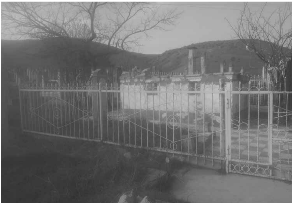
Сулѡейман-Стальский райондин Герейханован совхоздин 1-отделенияда авай Желил бубадин пѡир

Ширчи я Къурагъ Керим, Чаз Аллагъди урай регъим, Ви камалдиз хуьй аферин, Камалгъгли Желил буба.