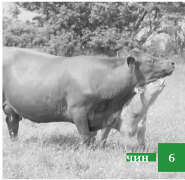
Иса пайгъамбардикайни чувуддикай ажайиб къиса