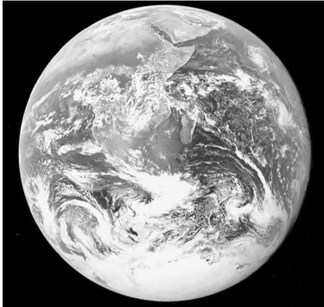
Аллагьди ﷻ халкънавай чилел Адаз аси жемир

- Гьикь! Мегер ам жедай кар яни, алемдал алай кьван мулкар вири Аллагьдинбур ﷻ я, вири Гьада