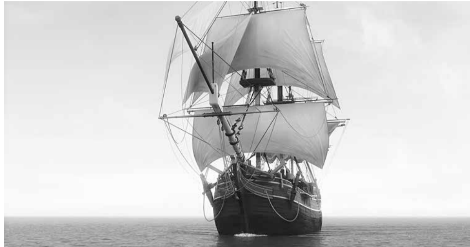
Кешишди гимидай гьуьлуьз хкадарна ва целай кьвачи-кьвачи фена акурла, Ибрагьимани гьуьлуьз хкадарна...