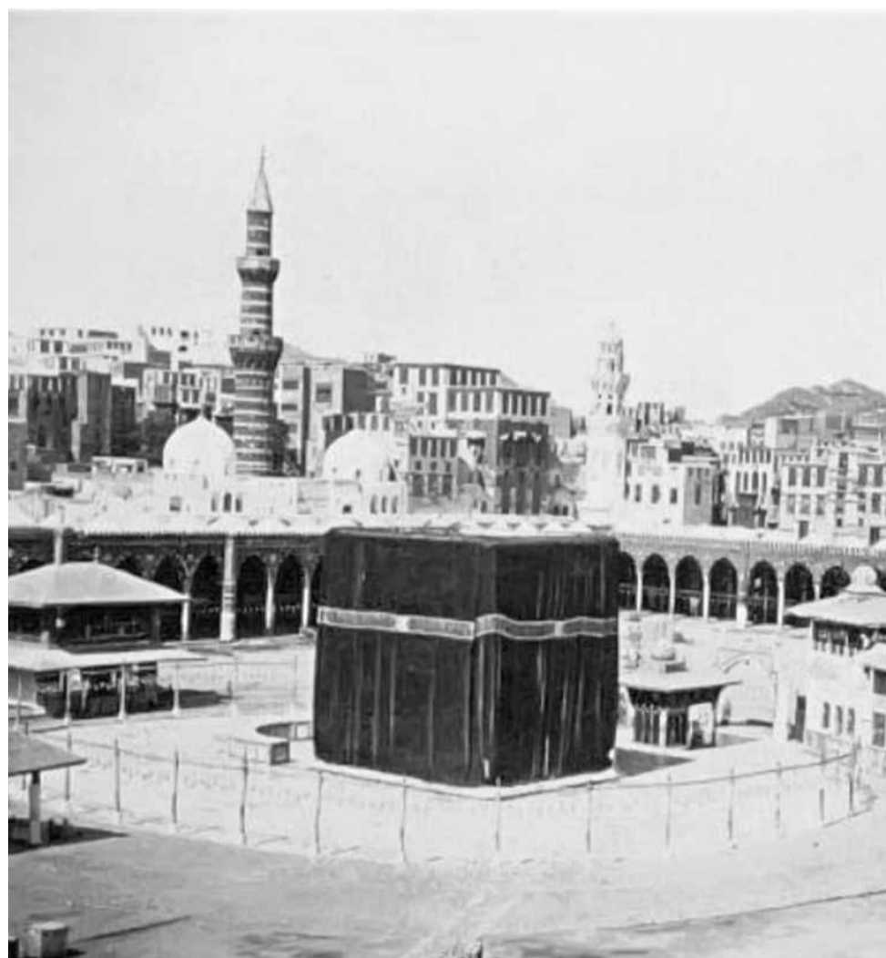
Чулав къван чкадал Пайгъамбарди ﷺ вичи эцигнай

Къбе – им Аллагъдиз ﷻ къуллугъ авун патал чилин винел эцигнавай сад лагъай кIвал я. Сифте яз Къбе Адама ﷺ эцигна ва ам гъа чIавузни исътда алай чкадал эцигнай. Аллагъди ﷻ Адаманин ﷺ Гъавадин патав Жабраил малаик ﷺ ракъурна ва абуроз Вичиз къуллугъдай чка эцигун буйругъна. Жабраила чилел жележгдин Къбедин план чIутуна. Эцигунар акъалтIарайдалай къулухъ, Сад тир Аллагъди ﷻ Адамаз ﷺ Къбедал тIаваф авун буйругъна. Амма са къадар вахтар алаатайла къизгъин вакъийаринни тIебиатдин шартIарин таъсирдик кваз Къбе чIана. Сифте яз Къбе цийи къилелай эциг хъувурди пайгъамбаррин буба Ибрагъим ﷺ я. Ада ам Аллагъдин ﷻ эмирдалди мушрикрин (гзаф гъуцариз икрамзавайбур) килиса (виликан Къбе) алай чкадал эциг хъува. Ибрагъима ﷺ эхцигай Къбе яргъалди амуькна, амма, марфарни тIурфанар себеб яз, ам къайдадикай хкатнавай. Къурейшитар къиле аваз араб тайифайрин регъберри Къбе къайдадик кухтун къетIна. И делилдай чаз акъазвайвал, меккевияр ата-бубайрилай инихъ, гъатта Ибрагъималай ﷺ инихъ Къбедив еке гъурметдивди эгечIавай. Мугъаммадани ﷺ Къбе туькIуьр хъувунин карда иштиракна. Чулав къван эхцигдай чкадив агакъайла, меккевийрин арада ам эхцигдай касдин патахъай гъуьжетар арадал атана. Гъар са тайифадиз чулав къван эхцигдай кас чпикай хъун кIанзавай.