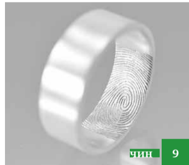
Къизил: зарар ва хийир