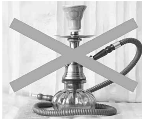
са йисуз къвалах хъийидай ихтияр ганва.

Сифтени-сифте мискӀинрин, больницайрин, мектебрин патарив гвай къалиянар чӀугвадай чкайри чпин къвалах акъвазарда. Амай чкайриз чпин и къвалах акъвазарун патал зур йис муьгълет ганва. Промышленность авай ва вацӀун къерехрал алай районура ихътин кафеириз гъеле