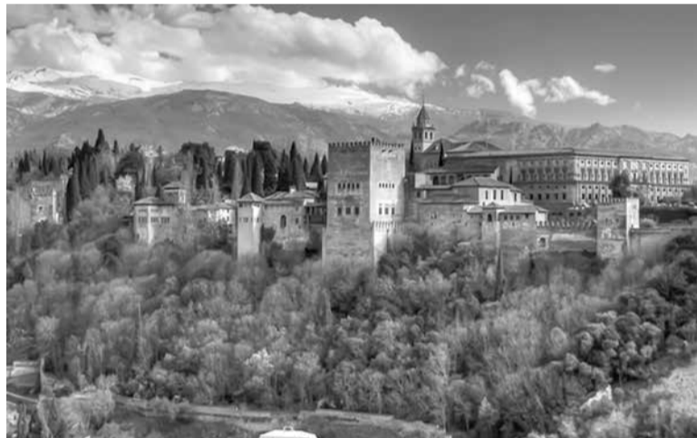
Къизилдикайни гимишдикай туьклуьрнавай квалер ва пачагъдин руш туна ам Исадихъ ﷺ галаз фена

тлалабна пачагъди. Пайгъамбарди пачагъдин вилик шарт эцигна: вичин дуьадалди хцел чан хтайтла, адаз (Исадиз ﷺ) гьиниз квандатла гъаниз фидай ихтияр гун, яни къуна тун тавун. Пачагъди адаз гаф гана. Исади ﷺ Аллагьдивай ﷻ тлалабна, гъасятда къенвай хцел чан хтана. Адал чан хтанмазди пайгъамбар абурун чилелай куьч хъана. Пачагъдин хва кечмиш хъана лугъуз халкъ пашман тушир, гъатта бязибур и кардал шадни тир. Ирсардал чан хтайла, абурун шадвал ажугъдиз элкъвена ва халкъ пачагъдиз акси яз къарагъна. «Къуьуз жедалди вичи чакай ягъанатар хкудайди бес хъаначни? Гила хцини чун чандивай авуна кванзавани?!» - лугъузвай абуру. Гаф вахтунда сабуру авур инсанривай пачагъдин хцел чан хтун эхиз хъхъанач. Бубани хва патал инсанар къве чкадал пай хъана сада-садан иви экъичиз эгечина. Вахтунда Исадин ﷺ гафарин гъавурда акъун тавур пачагъ къал-макъалда гъатна, адан къил гжи хъанвай. Хъсан меслят къабул тавурда четинвилера гъатайла шикаятарни авун лазим туш. Менфялту меслят къалурай касдиз чухсагъул лугъуз тахъайда ахпа «агъ!» лугъун тавурай.