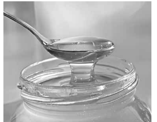
нетижда а вирт гзаф дадлу ва хийирлу жезва.

Чкадин чӀижрехъан Гунай Гундуза а вирт адетдин виртӀеделаи къиметдикай гъейри мад къелди тафаватлу ятӀа сир ачухна. Малум хъайивал, 1800 метрдин деринвал авай магъарадай акъудзава, анин «агъалиярни» вагъши чӀижер я. ЧӀижери чпин «бегер» хуьзвай магъарадин микроклиматдини ва анин цларин минералрин къурулушди виртӀедин тӀямдиз еке таъсирзава ва