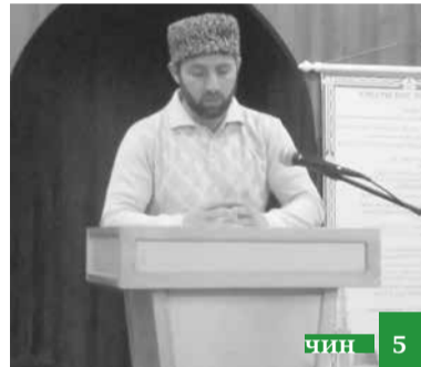
«Адетриз ваъ, Аллагъдин къанунриз муьтІуьгъ хъана кІанда»