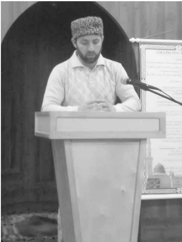
Мугъаммад-гъажиди насигъат ийизва

- Са шакни алачиз, обществодихъ галаз алакълу гъи кIвалах хъайитIани къиле тухуз четин жезвайди я, вучиз лагъайтIа куьне ийизвай са хъсан кар вирида сад хъиз къабудач, лугъудайвал, гъикъван инсанар аватIа, гъакъван фикирарни арадал къведа. Гуьгъуьна герек авачир рахунар-луькълуьнарни гзаф жеда. Ингъе куьне хуьруьн имамдин везифаяр тамариз саки къве йис хъанва, кIвалахда квел гъихътин четинвилер, татугайвилер, расалмиш жезва?