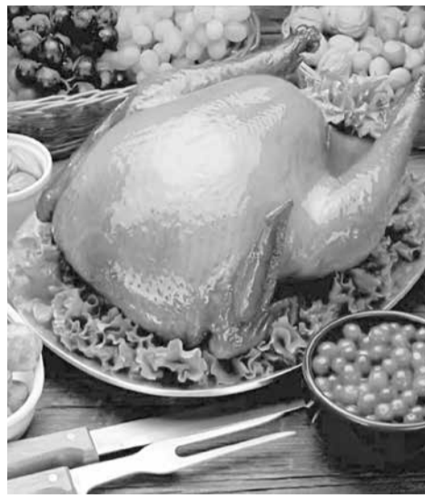
Нез тади ийимир, ам гьалал ятӱа килиг!

Гьалал къазанжидиз Исламди еке фикир гузва. И дуьньядани эбеди дуьньяда бахтлу кас хъун патал вуч авун лазим ятӱа Къуръандани Суннада гзаф лагъанва, гъаниз килигна кьве